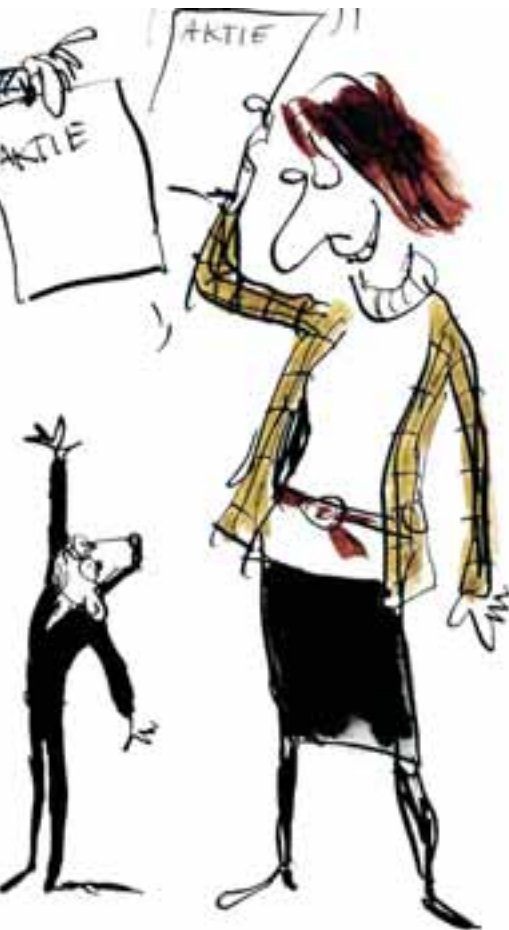
TEGNING: METTE DREIER

ner, vi går glip af. Skattekrone, som hårdtarbejdende kassedamer, hjemmehjælpe og buschauffører skal betale i stedet for de vellønnede, der typisk har medarbejderaktier og -obligationer«, siger Homann og fortsætter: