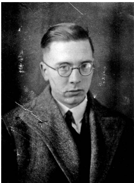
Georg Ferdinand Duckwitz, som han så ud i 1932 på sit NSDAP-Mitgliedskarte, som opbevares i Politisches Archiv des Auswärtiges Amtes i Berlin. Dette foto er, måske af gode grunde, aldrig blevet bragt i nogen af pjecerne, som det tyske udenrigsministerium har udgivet om Duckwitz.

Allerede i midten af 1950erne opstod der en stor politisk skandale, da de allierede kritiserede, hvor mange tidligere medlemmer af NSDAP fik høje stillinger i det vesttyske udenrigsministerium. Embedsmændene i ministeriet beskyttede hinanden. Nogle af embedsmændenes nazifortid viste sig ved, at de i deres tjeneste i efterkrigstidens tyske udenrigsministerium advarede tidligere ideologiske brødre, krigsforbrydere som Alois Brunner og Claus Barbie, så